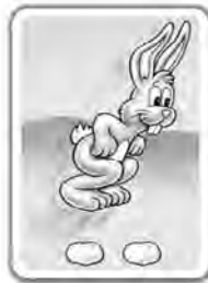
Avance de 2 cases