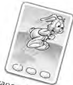
Avance de 3 cases