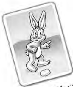
Avance d'1 case

Lorsque tu retournes une carte représentant un lapin, avance l'un de tes lapins vers le sommet du nombre de cases indiqué.